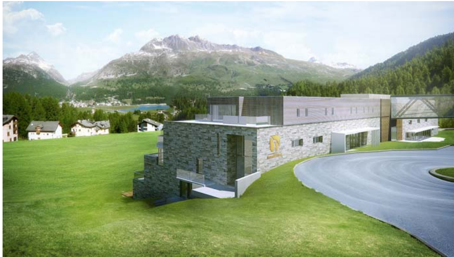
AlpineRock Hotel mit Passarelle (Computeranimation)