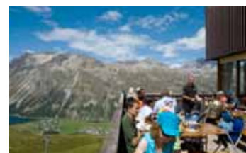
Bergrestaurant La Chüdera

Öffnungszeiten: 18. Juni – 16. Oktober 2011, Telefon +41 (0)81 838 73 55