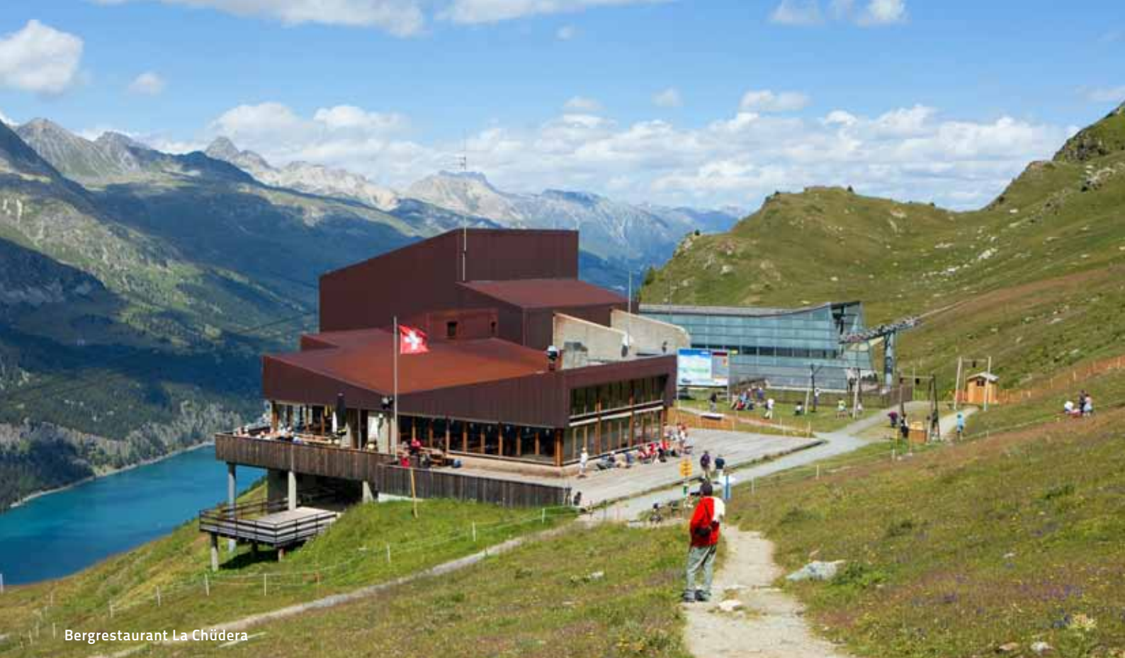
Bergrestaurant La Chüdera