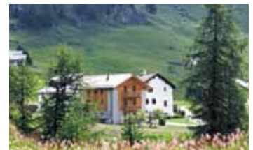
Pensiu Chesa Pool