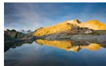
Berghaus Fuorcla Surlej